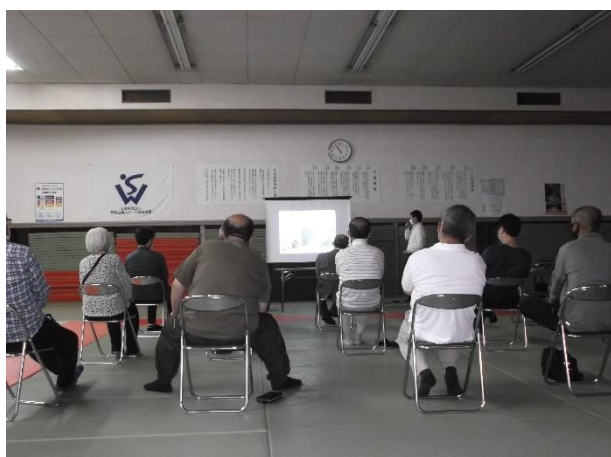
①災害時の写真を用いて説明

約20名の方々にご参加いただき、セミナーの最後には、避難所等で利用できる簡易スリッパを新聞紙で作成するなど講義だけでなく、実際に活用できるセミナーとなりました。