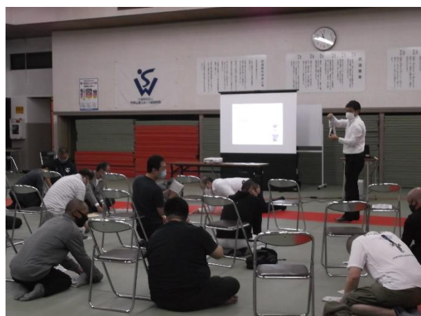
②簡易スリッパの作成